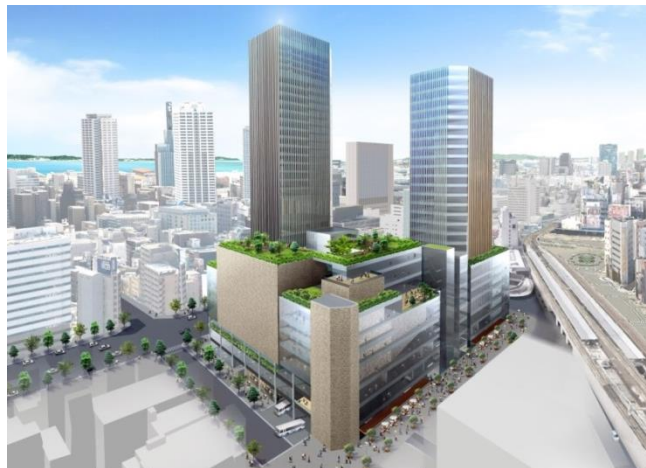
周辺エリアを含めた将来的なイメージ（北東から）

今後、再開発会社との間で基本協定を締結し、再開発会社の運営支援や都市計画提案など市街地再開発事業としての事業化の推進をサポートしてまいります。