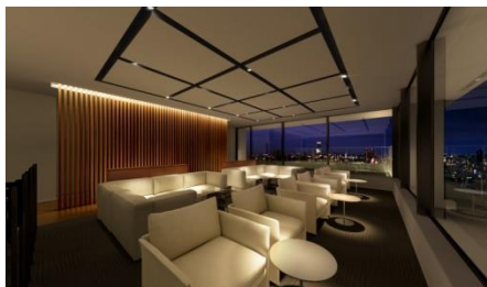
スカイラウンジ完成予想図