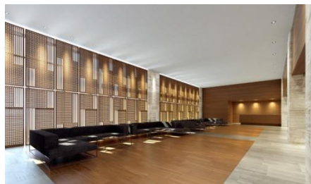
オーナーズホール完成予想図