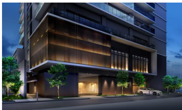
カーアプローチ完成予想図