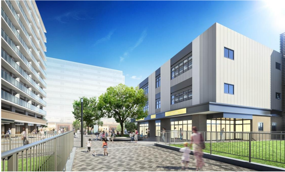
完成予想パース（事業区域中央から東側を望む）