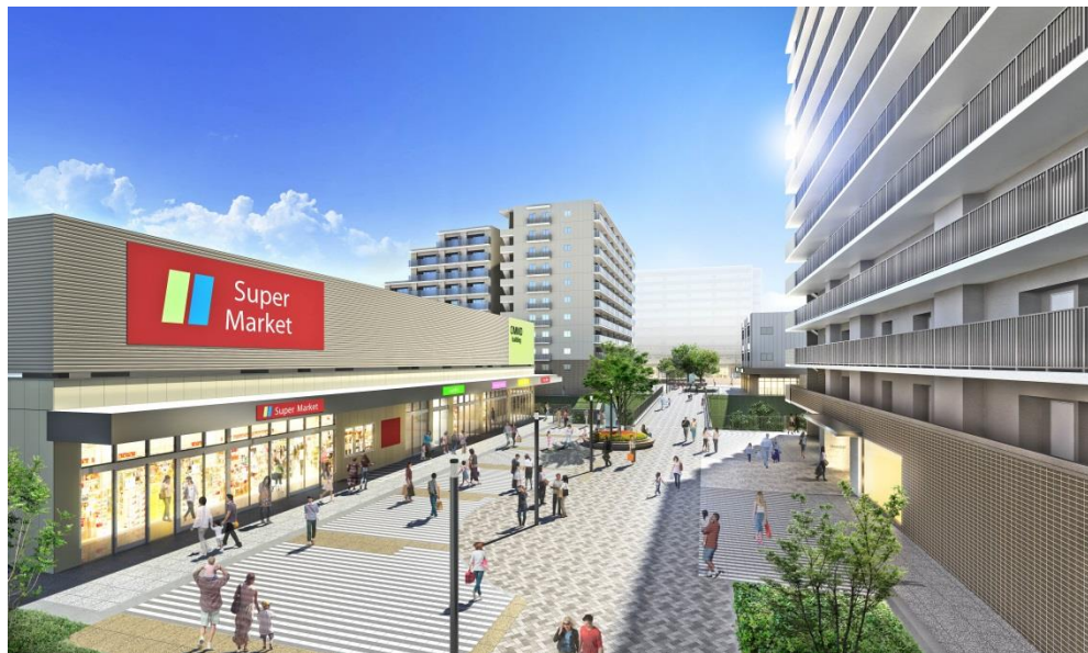
完成予想パース（事業区域西側から東側を望む）