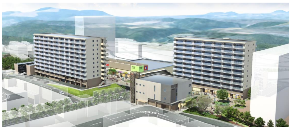
完成予想鳥瞰パース（事業区域南東側から北西側を望む）